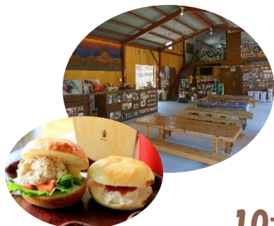
昼食は特製ベークル!!