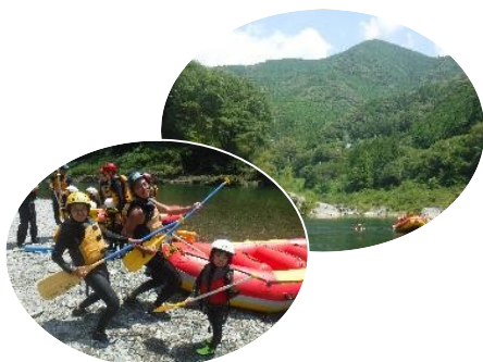
大自然の中を下ります!!